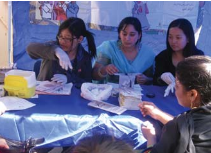
स्वयंसेवकहरु सुगर जाँच गर्दै

१५ नोभेम्बरमा वो लोक कम्युनिटी हेल्थ सेन्टर (Wo Lok Centre) मा शुरु गरीएको कार्यक्रममा १७० भन्दा धेरै दक्षिण एशियाली महिलाहरु र बच्चाहरुको उपस्थिति थियो । हामीले मधुमेह (डायाबेटिज) को रोकथाम बारे जानकारी दियो र ५८ जना महिलाहरुका सुगर जाँच गर्‍यो । त्यस मध्ये ३ जनाको सुगर बढि देखापरेको थियो । उनीहरुलाई उपचारको लागि बोलाएका छौ । स्वस्थ जीवनशैली जस्तै व्यायाम गर्ने, धेरै फलफूल र सागसब्जी खानुपर्छ भन्ने कुरालाई प्रचार गर्‍यो । बच्चाहरुले खेलेका अंगूरको खेल प्रख्यात थियो ।