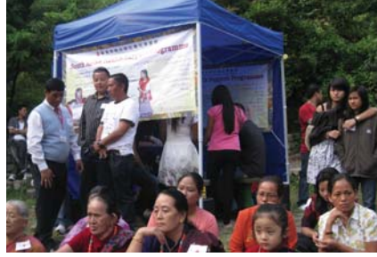
ताइ मो शानमा स्वास्थ्य चौकी