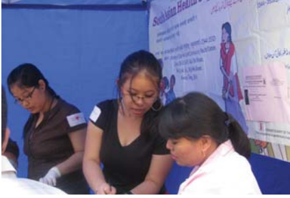
स्वास्थ्य सल्लाह दिँदै

दोस्रो कार्यक्रम १६ नोवेम्बरमा ताइ मो शान कन्ट्री पार्कमा नेपाली समुदाय ९ मिनेरी सेवा समिती० सँग मिलेर गरेका थियौ । १००० भन्दा धेरै मानिसहरुको उपस्थिती भएको त्यस कार्यक्रममा ४८ जनाको सूगर जाँच गर्दा २५ को सूगर बढी भेटियो, ४० जनामा ब्लड प्रेसर जाँच गर्दा ३५% को ब्लड प्रेसर बढी भेटियो । २७ जनामा ६३% को शरीरमा बोसोको मात्रा एकदम बढी थियो ।