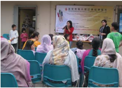
चोमोलोडमा मा स्वास्थ्य बारे जानकारी दिँदै

तेस्रो र अन्तिम कार्यक्रम २२ नोवेम्बर चोमोलोडमा मल्टिकल्चरल कम्युनिटी सेन्टर सँग मिलेर गरेका थियौ । स्वास्थ्य सम्बन्धि जानकारी र साधारण जाँच लगायत हामीले ९४ दक्षिण एशियाली महिला र बच्चाहरुलाई फ्लूको (रुगा खोकीको) खोप पनि लगाई दियौ । हाम्रो तालिममा आउनु अघि धेरै जसो महिलाहरुलाई यस सम्बन्धि जानकारी थिएन । यस कार्यक्रममा १२० भन्दा धेरै मानिसहरुको उपस्थिती थियो । ४३ जनाको ब्लड प्रेसर र सूगरको जाँच गरेका थियौ । त्यसमा २३% को बढी ब्लड प्रेसर ६.५% को सूगर बढी थियो।