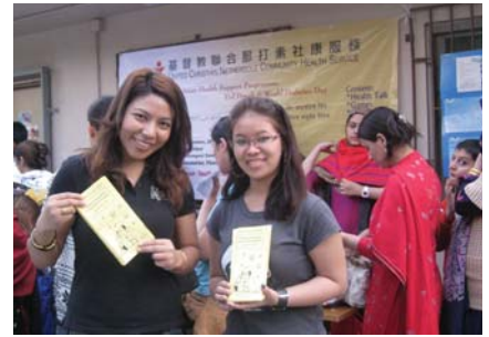
रुगाखोकीको रोकथामको लागि प्रचार

बढी रोग लाग्ने सम्भावना भएकाहरुलाई दक्षिण एशियाली स्वास्थ्य सहयोग कार्यक्रमले गरेका स्वास्थ्य कार्य : ब्लड प्रेसर र सूगर बढी हुनेहरुलाई गहन स्वास्थ्य सल्लाह दियौ र उपचारको लागि बोलायौ । तर यो कार्य सफल गराउनको लागि एकिकृत र निरन्तर कोशिश कायम राख्नुपर्छ ।