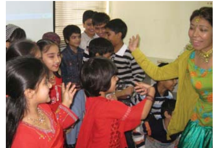
बच्चाहरु कार्यक्रमको लागि उत्सुक हुँदै