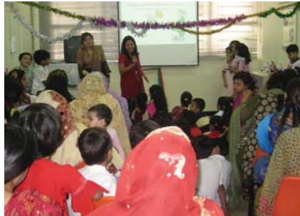
स्वास्थ्य बारे जानकारी दिदै